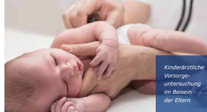
Kinderärztliche Vorsorge- untersuchung im Beisein der Eltern

Ihr Team der Abteilung Geburtshilfe der Diakonie Kliniken Hunsrück